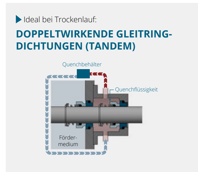
Abbildung: Kompaktes Pumpenaggregat mit doppelwirkender Gleitringdichtung (Tandem) und Quenchbehälter.